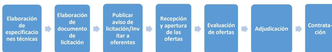
Ilustración 1. Etapas de una licitación pública nacional / privada

Centralizada y Descentralizada, se regirán por la presente Ley y sus normas reglamentarias” (Ley de Contratación del Estado, 2001). Donde el reglamento define el contrato de suministros de la manera siguiente: “Contrato de suministro: El celebrado por las autoridades competentes con una persona natural o jurídica que se obliga, a cambio de un precio, a entregar uno o más artículos, equipos u otros bienes muebles específicamente determinados, de una sola vez o de manera continuada o periódica...” (Reglamento de la Ley de Contratación del Estado, 2002). Donde los contratos de bienes, se hacen utilizando una de las siguientes modalidades: i) Licitación Pública; ii) Licitación Privada y iii) Contratación Directa. Un esquema de los pasos principales de un proceso de licitación pública y privada se detalla en la parte de abajo. Donde se puede observar que los procesos de públicas con privadas son muy similares y que su principal diferencia es que en uno se hace un llamado a través de la publicación en diarios y la otra se hace una invitación privada y directa a los posibles oferentes.