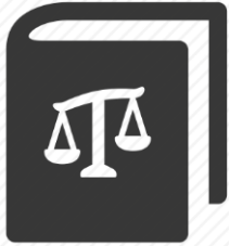
Constitución de la República

La Constitución de la República es la Ley suprema y de ella se derivan todas las otras leyes.